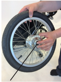
2. Tryck här för att lossa eller sätta på hjulen