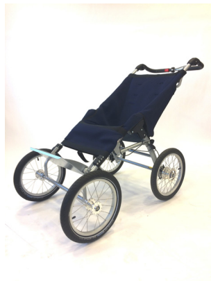
Multivagnen med framhjul offroad

Standardutförande: Klädsel, fotplatta, ställbar handtagsbygel och luftpumpade bakhjul.