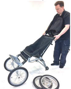
6. Slå ihop - ta av bakhjul