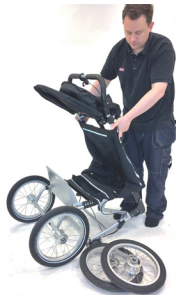
8. Vik sulkyvagnen framåt