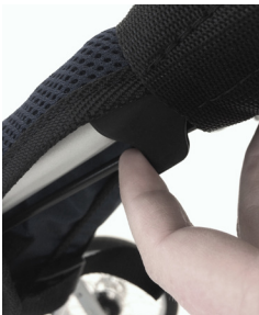
7. Skjut upp låsspärr på var sida samtidigt