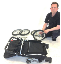
9. Fäll helt ihop och tag av framhjul vid behov