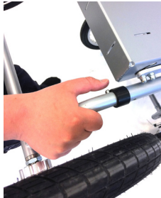
5. Tryck in låsspärr