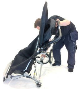
3. Slå upp chassi montera bakhjulen