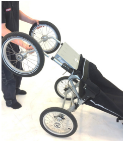
4. Montera på framhjul