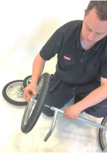
1. Montera hjul fram