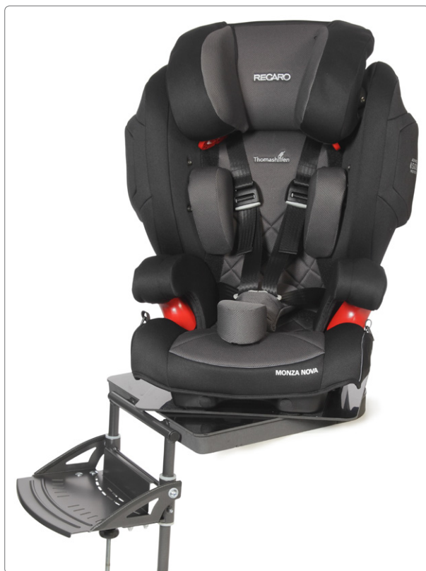
Vridplattan gör det enkelt att lyfta barnet i och ur bilbarnstolen.

Recaro Monza Nova Reha är en lätt och välutrustad, framåtvänd bilbarnstol för att ge barn med särskilda behov, det stöd dem behöver under färd i bil. Bilbarnstolen är utformad för att möta de högsta kraven på säkerhet och är godkänd enligt ECE-R44/04 för viktclass 15-36 kg.