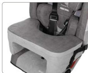
Underarmstöd / Bord