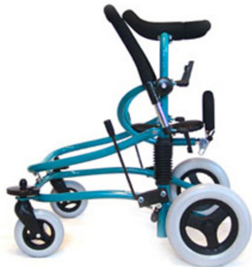
Miniwalk kan lätt ändras från storlek 1 till storlek 2 genom att byta de två sidovingarna.