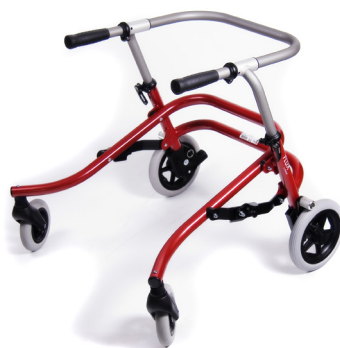
Flux storlek 1

Standardutförande: Handtag, riktningsspärr, släpbroms, backspärr och massiva hjul.