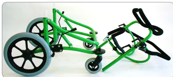
Den övre delen med sitheten kan lyftas av.

Gåstolen kan enkelt delas, en övre sitheten och en undre hjuldel, för att kunna transporteras i en personbil (kombi).