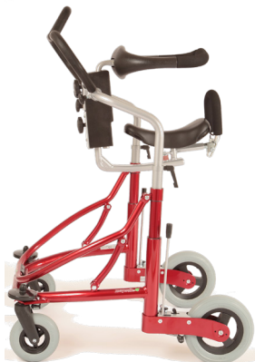
Meywalk 2000, storlek Medium

Standardutförande: Bålstödsring, sadel, fjädrar, handtagsbygel, parkeringsbromsar, avbärarhjul och massiva hjul.