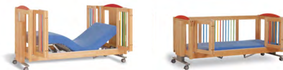
EMMA I med öppna långsidor.